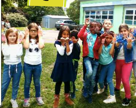
Chez les enfants (3-11 ans)