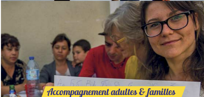
Accompagnement adultes & familles