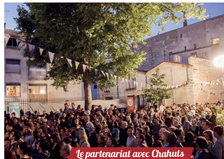
Le partenariat avec Chahuts