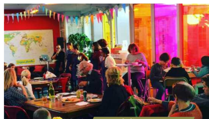
Autour de l'engagement

• 14h30 > 17h30 : ..... goûters signés avec La soupe aux mots : initiation à la langue des signes autour d'un goûter partagé • 14h > 18h : ..... ateliers créatifs