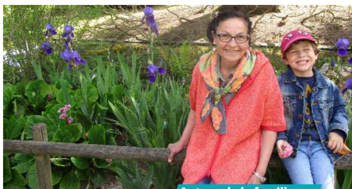
Autour de la famille

■ Accueils, sorties, séjours en France et de solidarité internationale, accompagnement de projets individuels et collectifs, chantiers éducatifs, passerelle préadolescents... pour et avec des jeunes de 13 à 18 ans • Du mardi au samedi (cf. programme sur notre site internet )