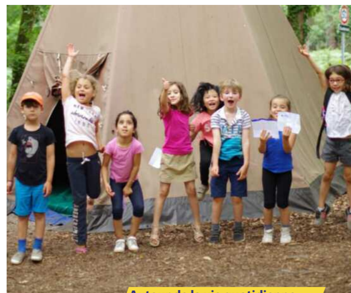
Autour de la vie quotidienne

> Tarifs en fonction des revenus (renseignements à l'accueil du centre)