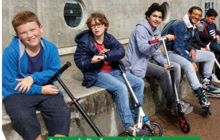
Autour de l'enfance et de la jeunesse

Cette plaquette vous donnera un aperçu des actions, activités et projets que nous menons en 2016-2017.