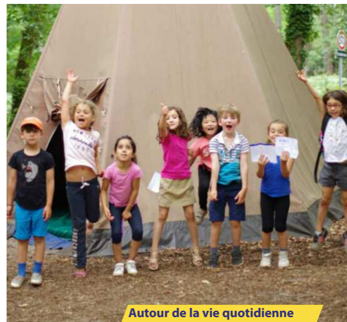
Autour de la vie quotidienne

• Carte tarifs préférentiels pour les spectacles programmés au TnBA > Tarifs en fonction des revenus (renseignements à l'accueil du centre)