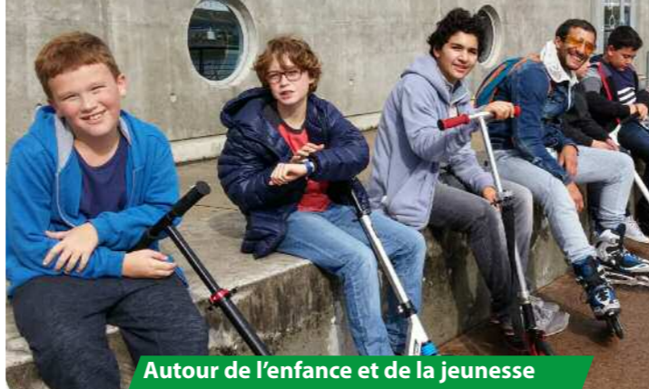
Autour de l'enfance et de la jeunesse

Cette plaquette vous donnera un aperçu des actions, activités et projets que nous menons en 2017-2018.