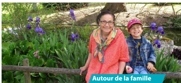
Autour de la famille